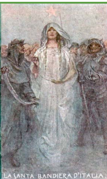
IL BIANCO, LA FEDE SERENA ALLE IDEE CHE FANNO DIVINA L'ANIMA NELLA CO- STANZA DEI SAVI.