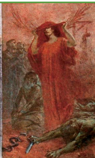
IL ROSSO, LA PASSIONE ED IL SANGUE DEI MARTIRI E DEGLI EROI. CARDUCCI.