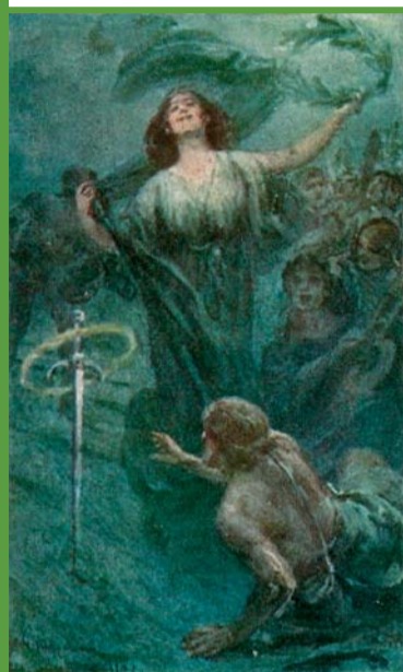
IL VERDE, LA PERPETUA RIFIORITURA DELLA SPERANZA A FRUTTO DI BENE NELLA GIOVENTÙ DE' POETI.